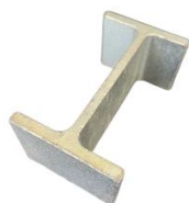
I-jern beslag 80 x 45 x 35mm