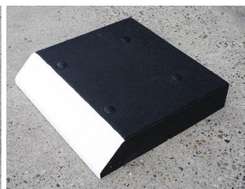
Midt skrå kant 50 x 50 x 10cm