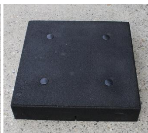
Midt lige kant 50 x 50 x 10cm