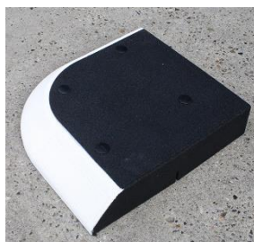
Hjørne 50 x 50 x 10cm