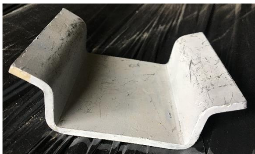
Beslag - galvaniseret