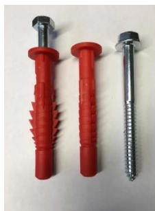
Skrue og plugs